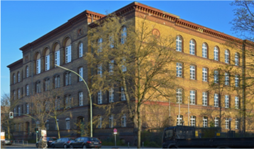
Verwaltungsakademie Berlin Turmstraße 86 10559 Berlin